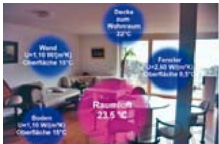
Abb. 2: Schlechte Dämmung: Trotz hoher Raumlufttemperatur große Unterschiede in der Wärmeverteilung im Raum, Wohnbehaglichkeit ist gestört

Die Abbildungen 2 und 3 zeigen für einen Wohnraum, dass bei besser gedämmten Bauteilen die Lufttemperatur um bis zu 4°C geringer sein kann, als bei schlecht gedämmten Bauteilen. Dies bedeutet weniger Energieverbrauch und ein gesünderes Raumklima, da die Schleimhäute bei geringerer Lufttemperatur weniger austrocknen.