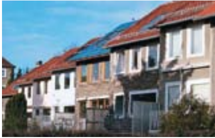
Abb. 11: Gebäude der Nachkriegszeit

versehen; ebenso sind oberste Geschossdecken bei nicht ausgebauten Dächern konzipiert. Fenster kommen sowohl einfach verglast als auch als Kasten- oder Verbundfenster zum Einsatz.