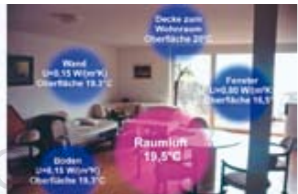
Abb. 3: Gute Dämmung: Trotz niedriger Raumlufttemperatur nur geringe Unterschiede in der Wärmeverteilung im Raum. Angenehme Wohnbehaglichkeit