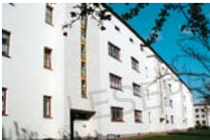
Abb. 9: Saniertes Gebäude der zwanziger Jahre

Holzfenster, zum Teil um Kastenfenster. Die Kellerdecke besteht aus einer Kappendecke, die entweder aus Beton oder aus Mauersteinen hergestellt und mit Holzdielen oder mit Verbundestrich und Terrazzo belegt wurde. Die oberste Geschossdecke ist in der Regel eine Holzbalkendecke mit oberseitigem Dielenboden und unterseitigem Putz auf Schilfrohrmatten oder ähnlichen Putzträgern.