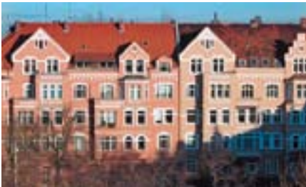
Abb. 7: Gründerzeithäuser

Der Heizwärmebedarf liegt bei diesen Gebäuden im Durchschnitt zwischen 200 und 350 \text{ kWh/m}^2\text{a} , je nachdem, ob es sich um freistehende Einfamilienhäuser, Reihenhäuser oder um mehrgeschossigen Wohnungsbau handelt.