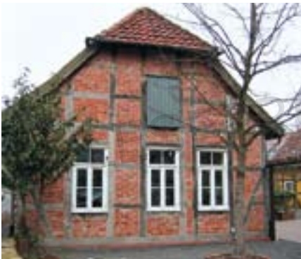
Abb. 5: Fachwerkhäus

Bei Gebäuden, die vor Beginn des 20. Jahrhunderts errichtet wurden, kann es sich um Fachwerkhäuser oder aber um verputzte Massivbauten handeln, über die selten noch Unterlagen vorhanden sind. Meist existieren ohnehin nur noch Fragmente des ursprünglichen Zustandes, der im Lauf der Zeit mit zahlreichen An- und Umbauten verändert wurde, es sei denn, die Gebäude standen unter Denkmalschutz. Zudem weisen sie regional konstruktive Unterschiede auf.