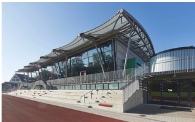
Außenansicht des Julius Hirsch Sportzentrums in Fürth © fab_Architekten / Ben Van Skyhawk