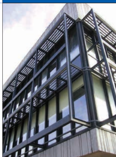
Abb 5: Markante Details der Fassade

Das Bibliotheksgebäude ist nicht unterkellert, die Bodenplatte ist ungedämmt. Etwa ein Drittel der spezifischen Transmissionswärmeverluste ergeben sich an den erdreichanliegenden Flächen. Eine Verbesserung dieser Situation war wirtschaftlich nicht vertretbar.