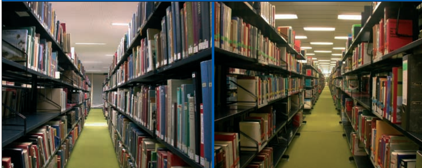
Abb 6: Die neue Leuchtenanordnung berücksichtigt die Möblierung

Bei einem Verhältnis von Fassade zu Bibliotheksfläche von 1:7 reicht in den Innenzonen die Tageslichtversorgung trotz der großen Glasflächen nicht aus. Zusätzlich beeinträchtigt die Regalaufstellung die Verteilung von Tages- und Kunstlicht. Das einheitliche Leuchtenraster ließ keine individuellen Anpassungen zu - im Inneren wurde zu wenig, in den Fassadenbereichen zuviel Beleuchtungsstärke gemessen. Eine bedarfsorientierte Steuerung fehlte.